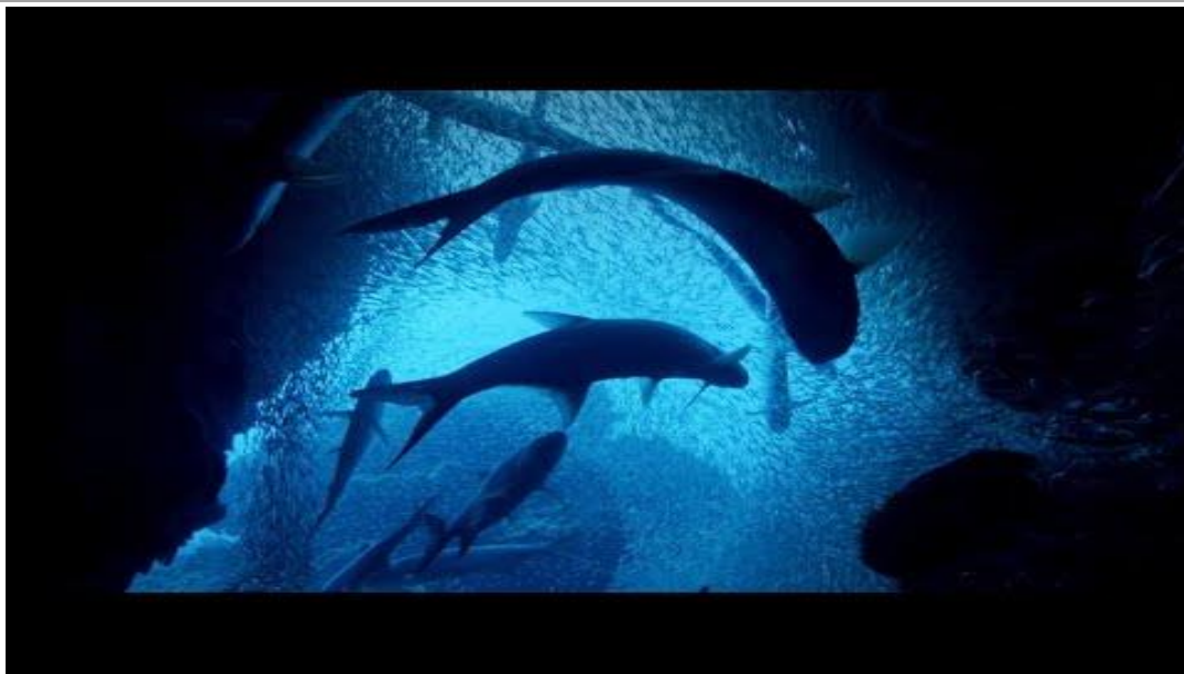
Biblijos pamokėlė „Pasaulio sukūrimas“: 1. Vaikų pamokėlė - Pasaulio sukūrimas