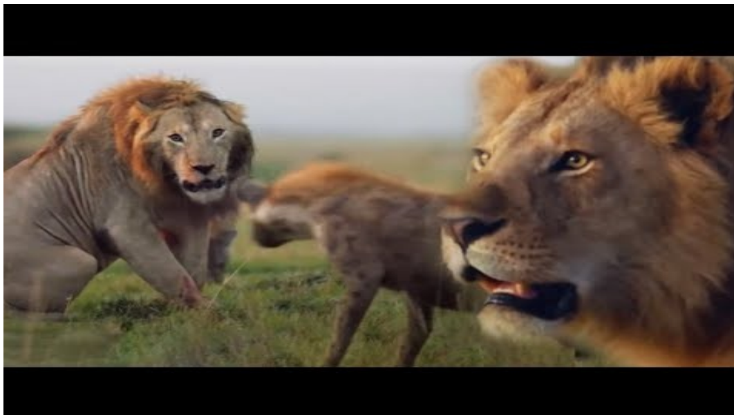
ONE HOUR Of Amazing Ocean Moments | BBC Earth

Video apie gyvūniją: ONE HOUR of Amazing Animal Moments | BBC Earth