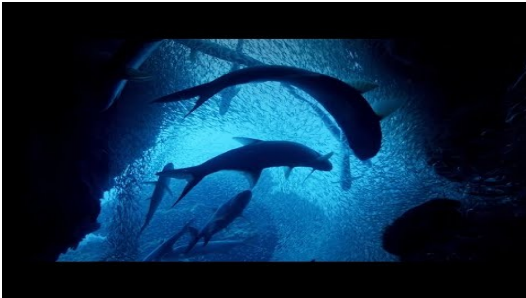
Biblijos pamokėlė „Pasaulio sukūrimas“: 1. Vaikų pamokėlė - Pasaulio sukūrimas