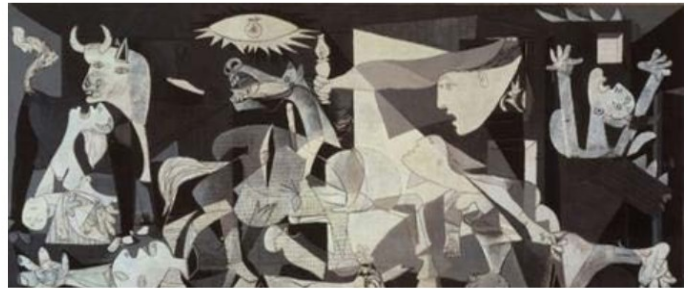
Pablas Pikasas (Pablo Picasso). Gernika (1937)

Kubizmo tėvas: 10 žymiausių Pablo Pikaso tapybos darbų. Interneto prieiga: https://vilniausgalerija.lt/2019/04/28/kubizmo-tevas-10-zymiausiu-pablo-pikaso-tapybos-darbu/ [žiūrėta 2019-12-04]