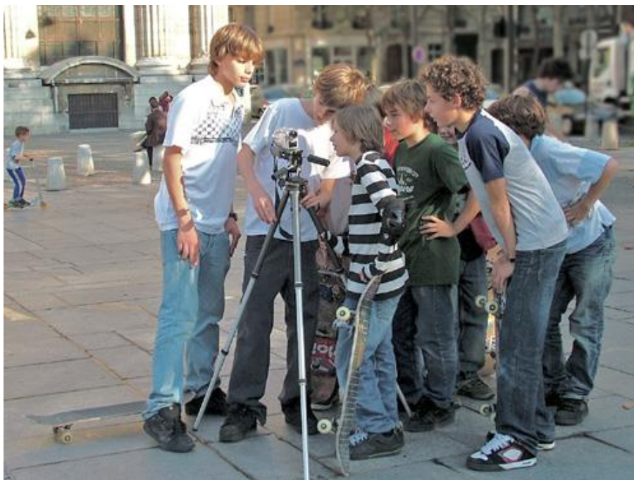
Autorė Elena Tervidytė. Nuotrauka iš 2011 m. lapkričio 17 d. „Dialogo“ Nr. 42.

Работа в группах должна пробудить воображение учеников; во время обсуждения будет совершенствоваться текст рассказа; работа со словарём обогатит язык и стиль повествования. Такая работа чрезвычайно полезна особенно тем ученикам, кому недостаёт творческих навыков составления текста. Совместная работа помогает упорядочить мысли, продумать аргументы и обогатить лексический запас ученика.